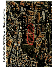
Οδοπορικό ακριβόγραμμα - θέση ακριβούς